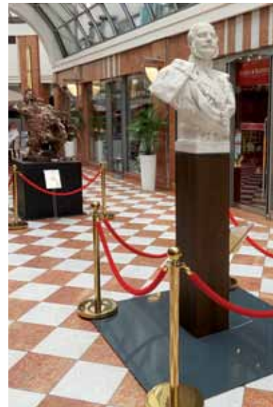
Die Skulpturen „Georg V.“ und „Eitelkeiten“ waren in der Kröpcke- Passage ausgestellt.