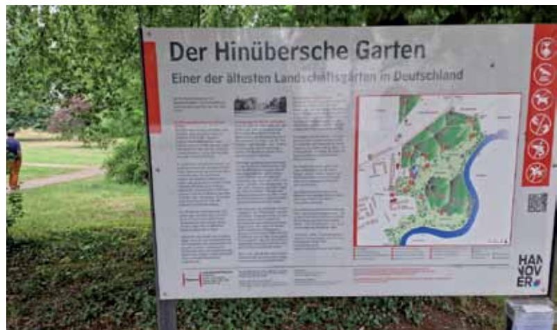
Der Hinübersche Garten in Marienwerder zählt zu den frühesten Landschaftsgärten in Deutschland.

kündigungen werden sowohl von Mitgliedern als auch Nichtmitgliedern bundesweit nachgefragt. Unser praktisches – weil kompaktes – Mietvertragspaket umfasst alles für die Vermietung Notwendige: vom doppelten Vertragsexemplar, über Hausordnung, Übergabeprotokoll, Abnahmeprotokoll, Wohnungsgeberbestätigung, Hinweise zur Mietpreisbremse bis zu den Datenschutzinformationen. Das juristische Angebot wird von den Rechtsexperten des Vereins ständig aktualisiert und ist somit immer auf dem neuesten Stand. In 2023 verkaufte die HAUS & GRUNDEIGENTUM Medien allein rund 23.000 dieser Mietvertragspakete.