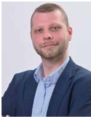
Florian Eve Projektmanagement HAUS & GRUNDEIGENTUM Medien

Mietverträge für Wohnraum, Garage, Gewerbe und spezielle Formulare für z. B. Mieterhöhungen und Modernisierungsan-