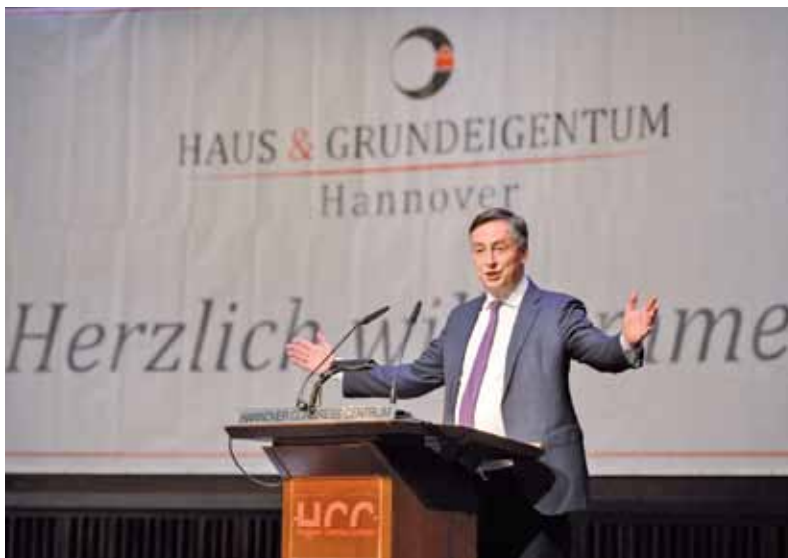
Der ehemalige Ministerpräsident und jetzige Europa-Abgeordnete David McAllister gratulierte HAUS & GRUNDEIGENTUM auf der Festveranstaltung zu seiner 130-jährigen Erfolgsgeschichte.

erhöhen müsse. Nicht ohne Erfolg. Zu guter Letzt wurde der Gesetzesentwurf – auch auf Intervention der CDU-Fraktion – im Bundestag immerhin deutlich entschärft.