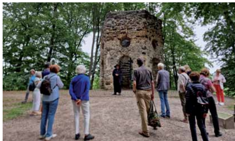
Mitglieder vor dem "Hexenturm" in der Leinemasch

Im letzten Jahr konnten wir auch wieder eine breit gefächerte Auswahl an Informationsveranstaltungen, Fachvorträgen und Seminaren für den Verein durchführen. Die Teilnehmerzahl von annähernd 1000 Mitgliedern belegt das hohe Interesse daran.